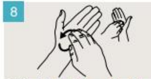
Frótese la punta de los dedos de la mano derecha contra la palma de la mano izquierda, haciendo un movimiento de rotación, y viceversa.