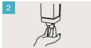
Aplique suficiente jabón para cubrir todas las superficies de las manos.