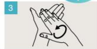
Frótese las palmas de las manos entre sí.