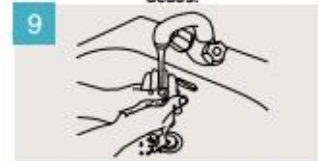
Enjuáguese las manos.